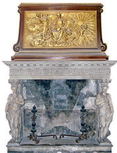
▲ Зал Трех Глав Совета Десяти, где собирались три главы совета и оглашали его решения, также украшает камин из истрийского камня.

А теперь немного подробнее о каминах, в реставрации которых участвовала компания Palazzetti , и о помещениях, в которых они установлены.