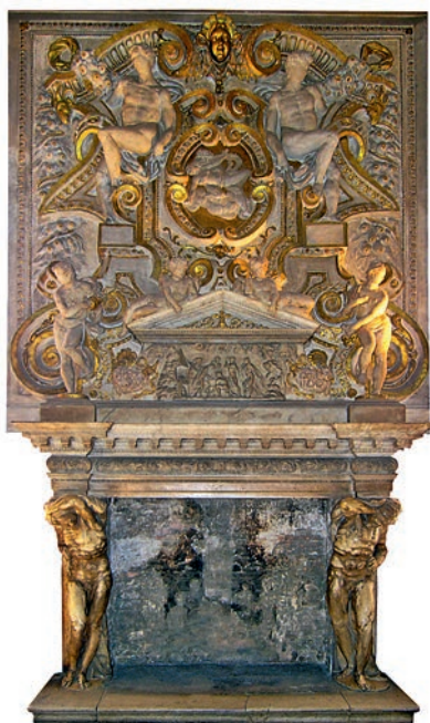
▲ Зал Антиколлегии — комната, в которой послы и иностранные делегации ожидали приема в Зале Коллегии. Здесь стоит камин XVI века из каррарского мрамора, декорированный фигурами атлантов.