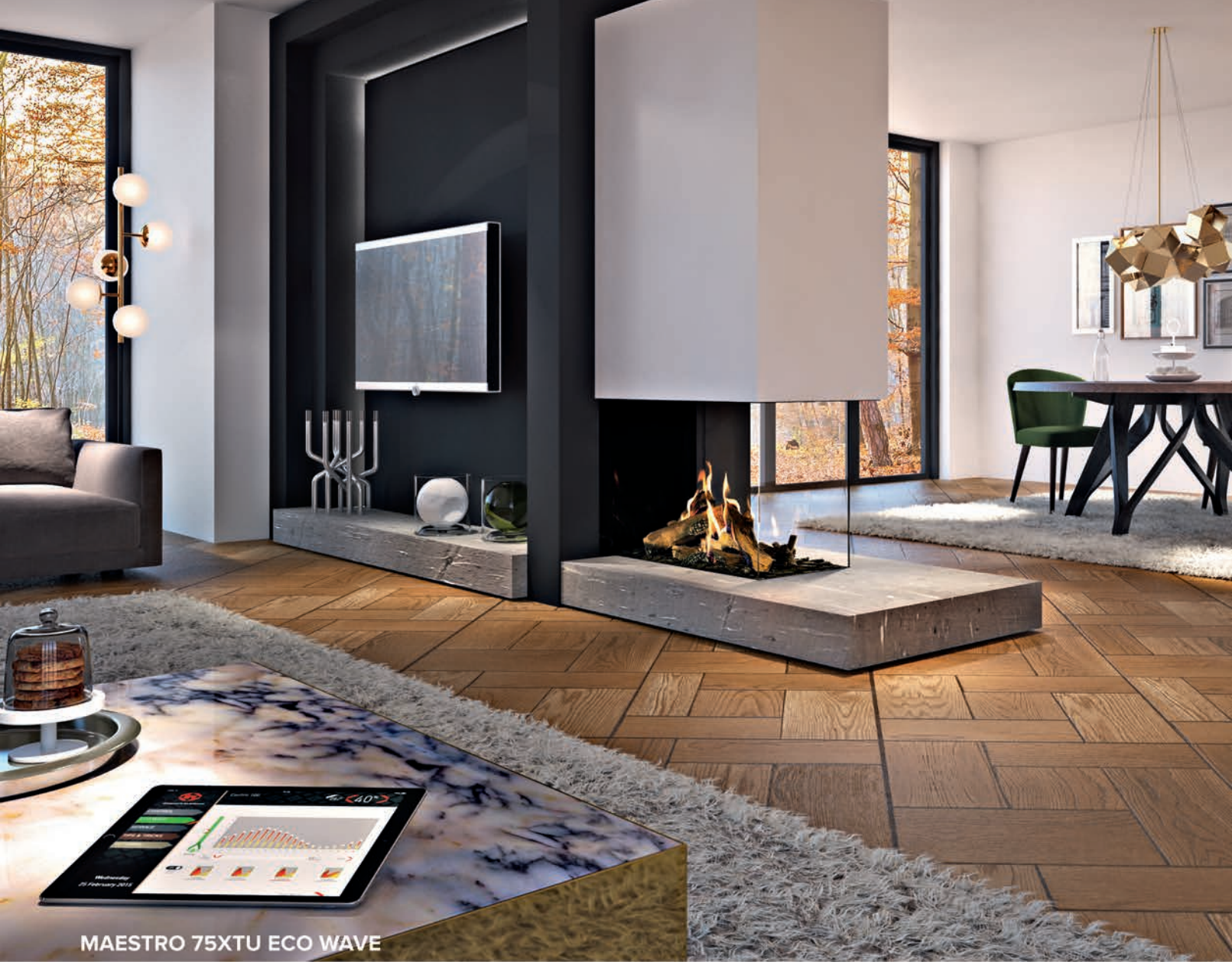
MAESTRO 75XTU ECO WAVE