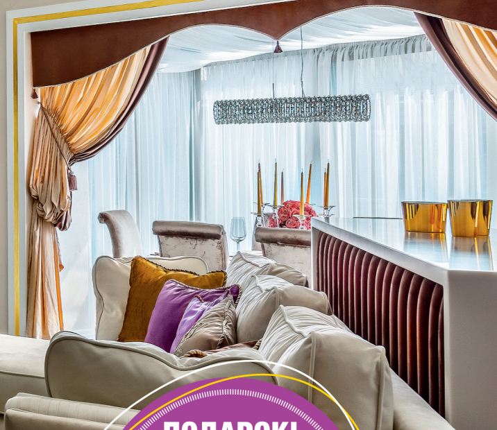
Мария Родионовская: превзойти ожидания с.28