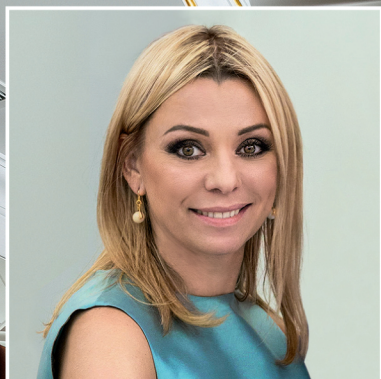
Ирина Салтыкова: время перемен с.62